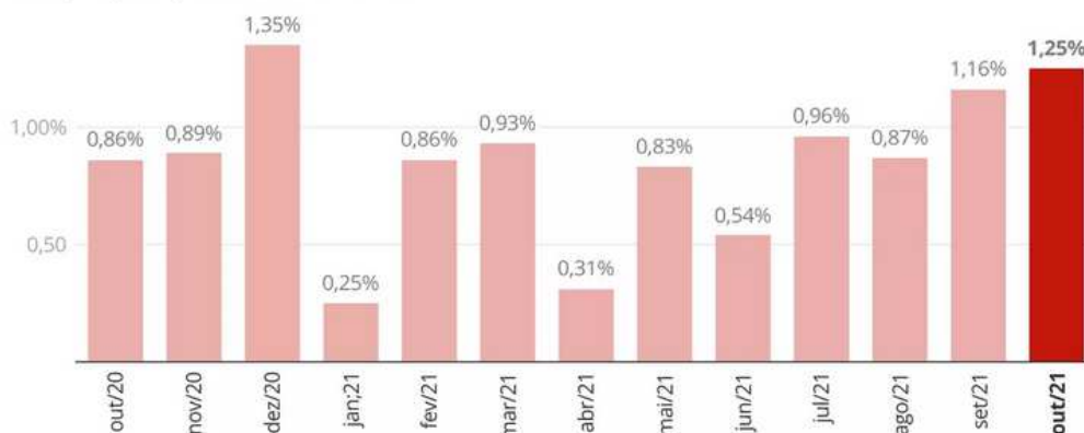
Gráfico: Economia/G1 • Fonte: IBGE